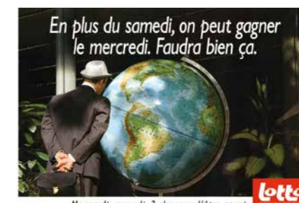
L'affiche Lotto, agence Lowe Troost, 1993.

Tout comme le Lotto, le cyclisme fédère les gens et leur offre une forme de divertissement responsable. En plus de son équipe cycliste, la Loterie Nationale soutient le cyclisme belge à de nombreux niveaux. Cela va du soutien aux signaleurs jusqu'à l'organisation de courses. Aucun autre sponsor n'a été présent aussi longtemps sans interruption au sein du peloton.