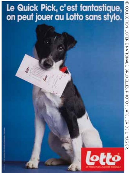
L'affiche Quick Pick, agence Lowe Troost, 1993.