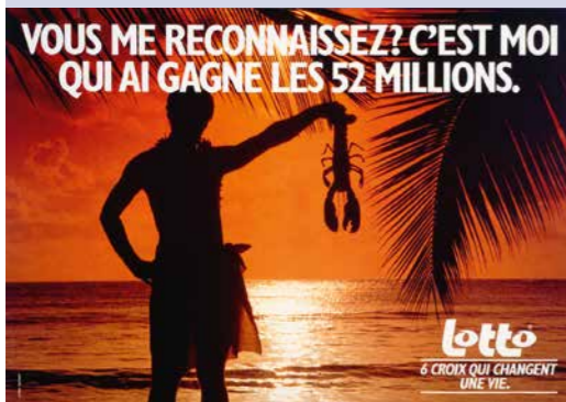
L'affiche Lotto, agence Lowe Troost, 1989.