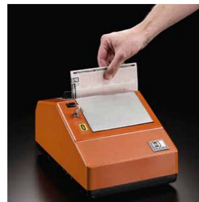
Le premier appareil de validation du Lotto, fabriqué par la firme suédoise Hugin en 1978.

45 boules virevoltent nerveusement dans un tambour transparent. 6 d'entre elles s'apprêtent à faire le bonheur d'un joueur en Belgique. Depuis déjà 45 ans, le Lotto offre des chances aux habitants de notre pays et est l'un des jeux les plus importants de la Loterie Nationale.