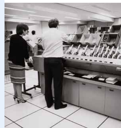
Le traitement des formulaires Lotto au début des années 1980.